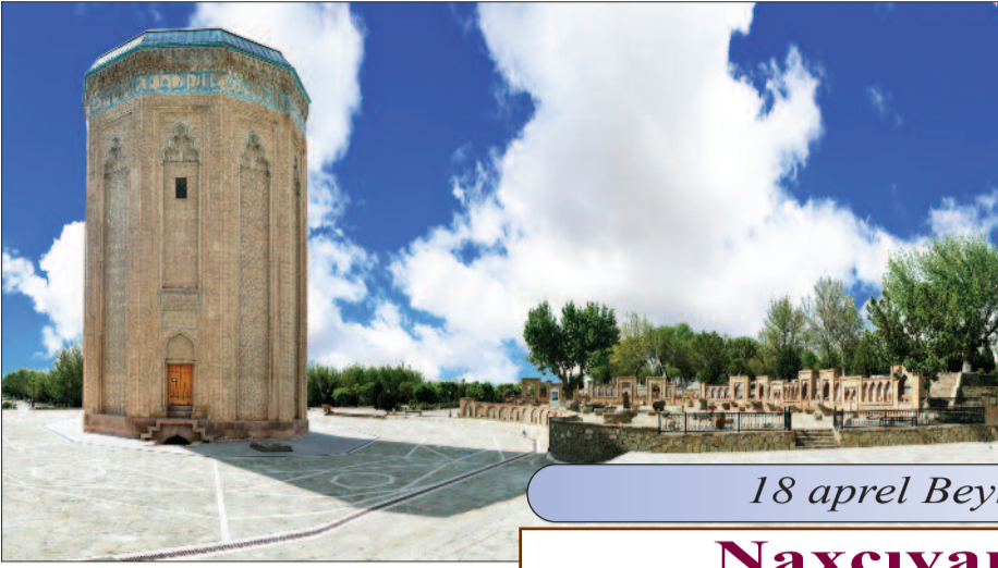
1982-ci ildən UNESCO-nun qərarı ilə hər il aprelin 18-i dünyada "Beynəlxalq Abidələr və Tarixi Yerlər Günü" kimi qeyd olunur.

Azərbaycan bəşər sivilizasiyasının ilkin meydana gəldiyi ərazilərdəndir. Bu səbəbdən də xalqımızın tarixi qədim yaşayış məskənlərində və çoxsaylı abidələrdə öz əksini tapmışdır. Əcdadlarımızın yadigarı olan abidələr xalqın keçmişinin, qədim mədəniyyətinin göstəricisi, minilliklərlə boyu bu torpaqlarda yaşadıklarını sübut edən daş yaddaşdır.