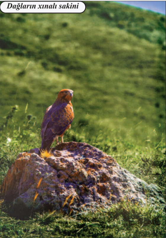
Dağların xınlı sakini